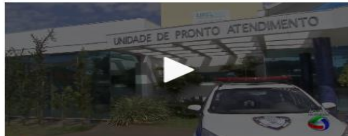
Criança passa mal em creche de Campo Grande

Por TV Morena 05/07/2017 14h43 - Atualizado 05/07/2017 16h44